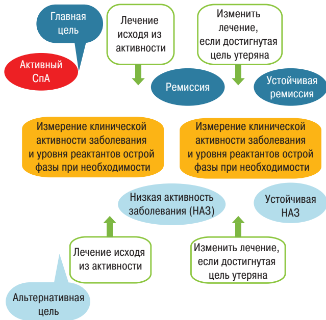
Рис. 1. Алгоритм терапии T2T (лечение до достижения поставленной цели) при СпА

новятся альтернативные направления, связанные с лечением пациентов исходя из функциональной активности и отсутствия позитивной лабораторно-инструментальной динамики.