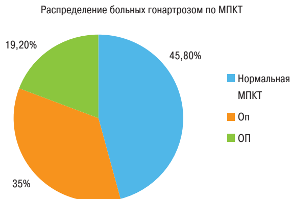
Рис. 1. Распределение больных гонартрозом по уровню МПКТ

дование. Для оценки выраженности боли в суставах использовали альгофункциональный индекс Lequesne, индекс WOMAC. У всех больных рассчитывали ИМТ. Рентгенографию коленных суставов осуществляли по стандартной методике в переднезадней и боковой проекциях. Рентгенологическую стадию гонартроза устанавливали согласно классификации Kellgren — Lawrence.